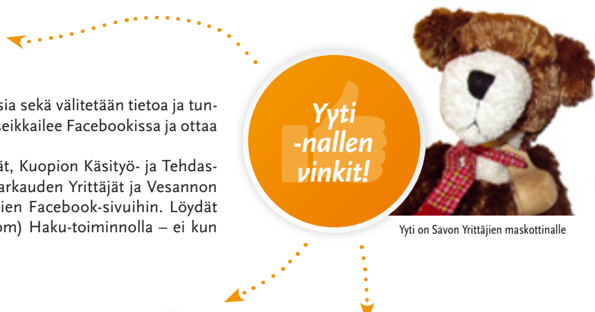
Yyti on Savon Yrittäjien maskottinalle

Facebookissa ovat myös mm. Kiuruveden Yrittäjät, Kuopion Käsityö- ja Tehdasseuruus, Kuopion Yrittäjät, Lapinlahden Yrittäjät, Varkauden Yrittäjät ja Vesannon Yrittäjät. Kannattaa myös tutustua Suomen Yrittäjien Facebook-sivuihin. Löydät edellä mainitut sivut Facebookin ( www.facebook.com ) Haku-toiminnolla – ei kun ”veispuukkaamaan” yrittäjien kanssa!