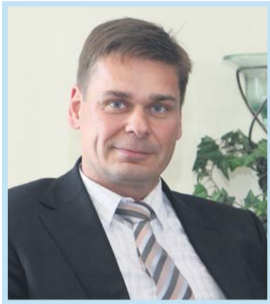
Jari Larikka, kansanedustaja

Suomalaisten pitäisi pysyä työelämässä jopa yli 70-vuotiaiksi, jos kansan huoltosuhde halutaan pitää nykyisenlaisena. Siinä korutonta faktaa suomalaiselle nuorelle, kun hän etsii ensimmäistä työpaikkaansa työmarkkinoiltamme. Sopii vain toivoa, että usko järjestelmäämme säilyy ja halu maksaa eläkemaksuja pysyy lujana.