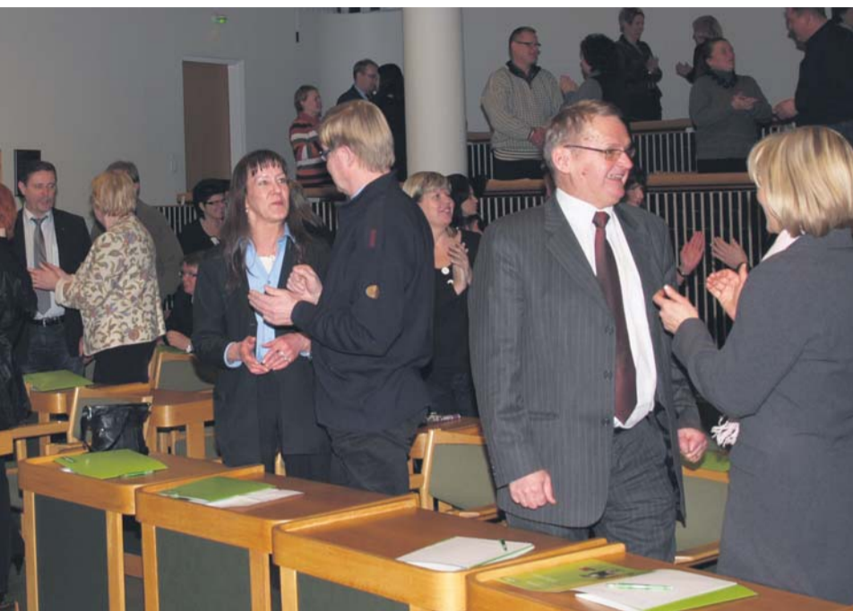
Yrittäjien Iltakoulussa noin sata yrittäjää oppi rohkeutta, myönteisyyttä ja kehon kieltä.

- Mitä näkyvämpiä olette, sitä helpompi teidän kansanne on tehdä töitä, näyttelijä toteaa ja heittää haas-