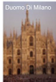
Duomo Di Milano

Hinta: 862€/hlö (sis. lennot Kuopio-Milano-Kuopio, majoituksen 3 yötä 2hh huoneessa aamiaisineen, lentokenttäkuljetukset, yritysvierailut, opastetun kiertoajelun 2h)