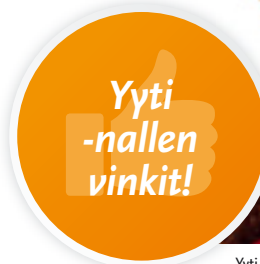
Yyti on Savon Yrittäjien maskottinalle

www.savonyrittajat.fi sivuilta löydät aina ajankohtaista tietoa yritystoiminnasta, verotuksesta, koulutuksesta, työsuhdeasioista ja sosiaaliturvasta. Kirjautumalla sivustolle jäsennumerollasi saat erityisesti jäsenien käyttöön suunniteltuja asiantuntijamateriaaleja. Tarjolla on mm. työsuhde-, matkalasku- ja kuluselvityslomakkeita, palkkatalukoita, verotuksen päivämäärät, hakemistopalveluja koskevat erikoissivut ja paljon muuta hyödyllistä tietoa. Käy tutustumassa!