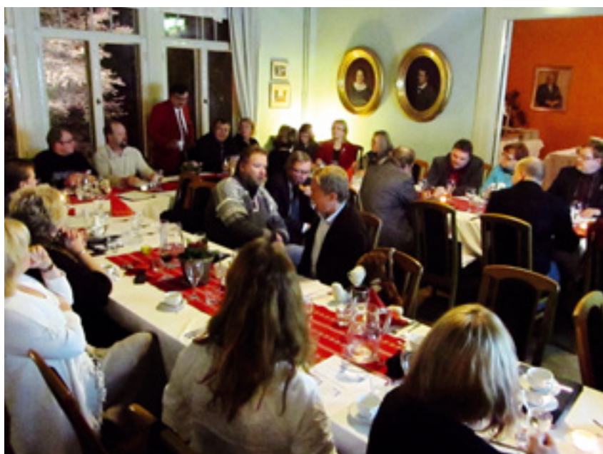
Savon Yrittäjien hallituksen järjestäytymiskokouksessa oli paikalla runsas joukko sekä uutta että entistä hallitusväkeä.