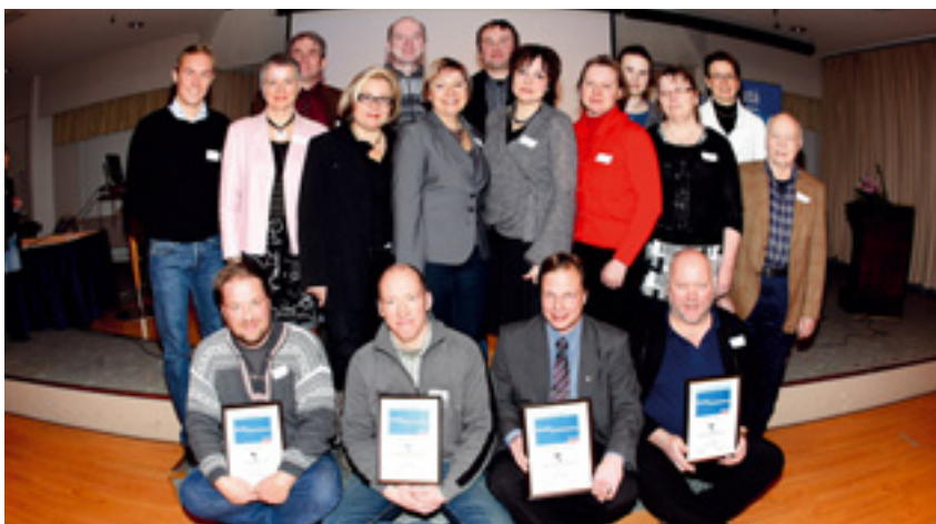
Savon Yrittäjät palkitsee vuosittaisessa järjestökoulutuksessaan vuoden paikallisyhdistykset. Vuoden 2009 toiminnasta palkittiin viime vuonna Vesannon Yrittäjät, Suomenjoen Yrittäjät, Kuopion Yrittäjät ja Iisalmen Yrittäjät.