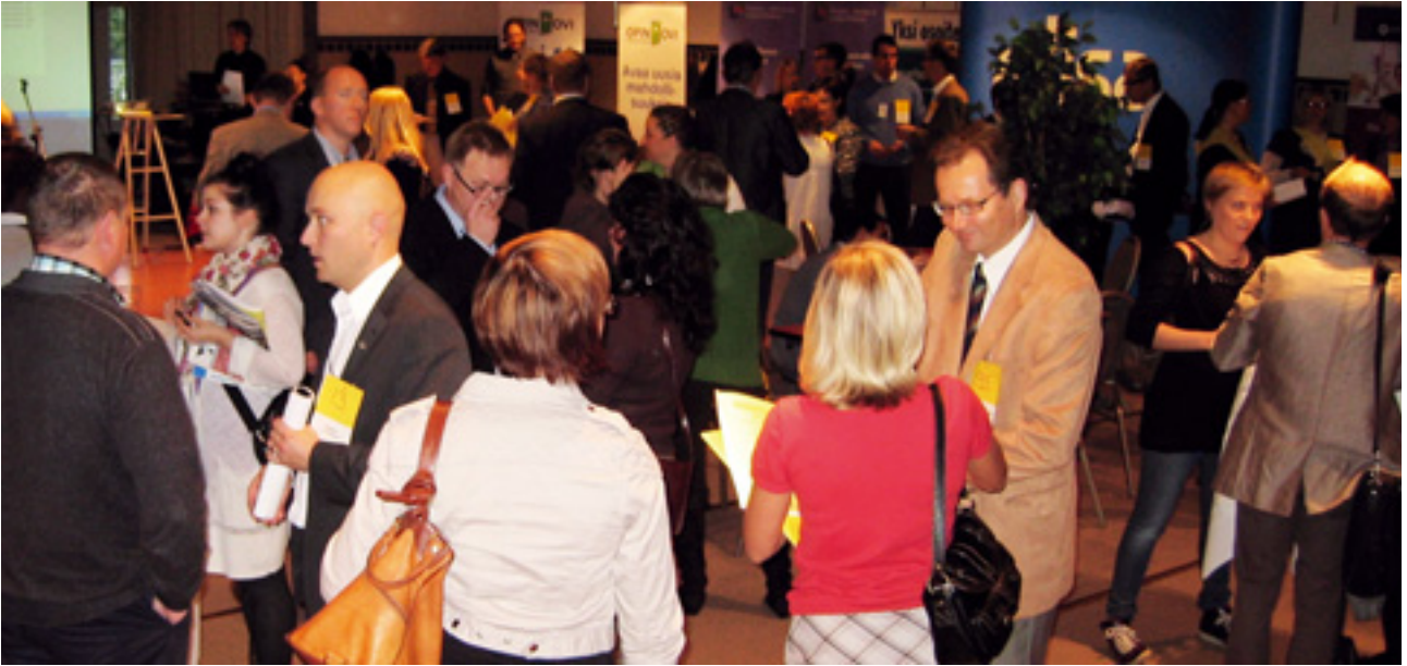
Pisnesrehveiltä haetaan potentiaalisia uusia asiakkaita, alihankkijoita ja yhteistyökumppaneita sekä tietoa ja uusia vinkkejä.