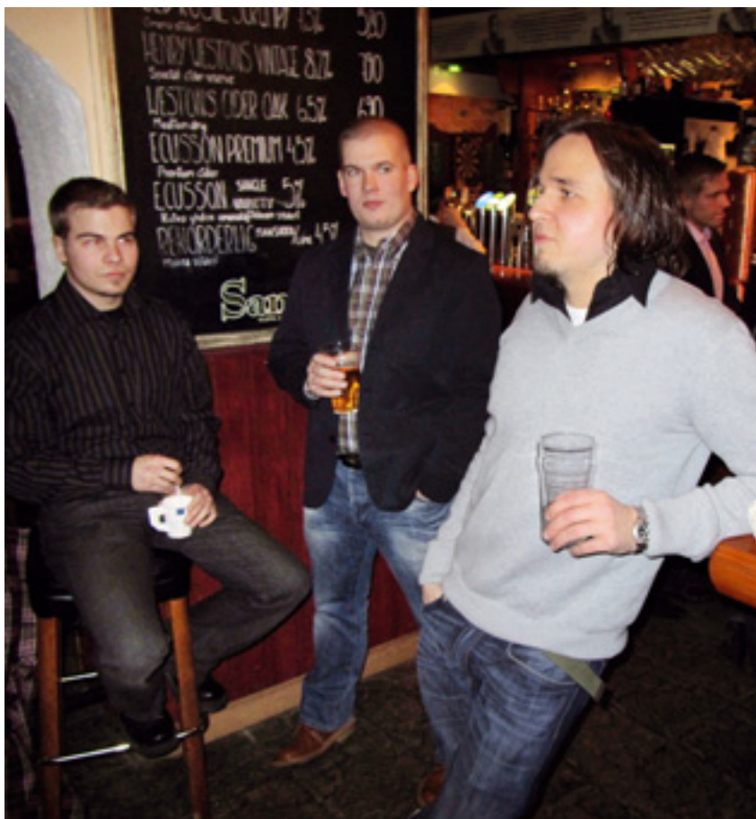
Savon Yrittäjien Nuorten Yrittäjien pikkujoulut ja stand up -ilta järjestettiin Kuopiossa 10.12.2010.