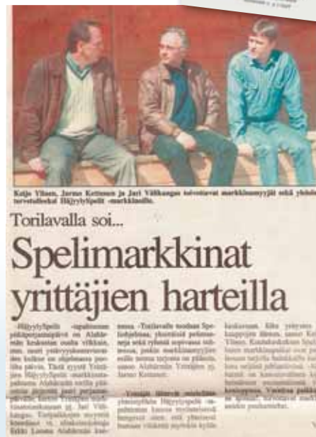
Ja vuonna 1998 järjestettiin Spelimarkkinat! Härmät-lehti.