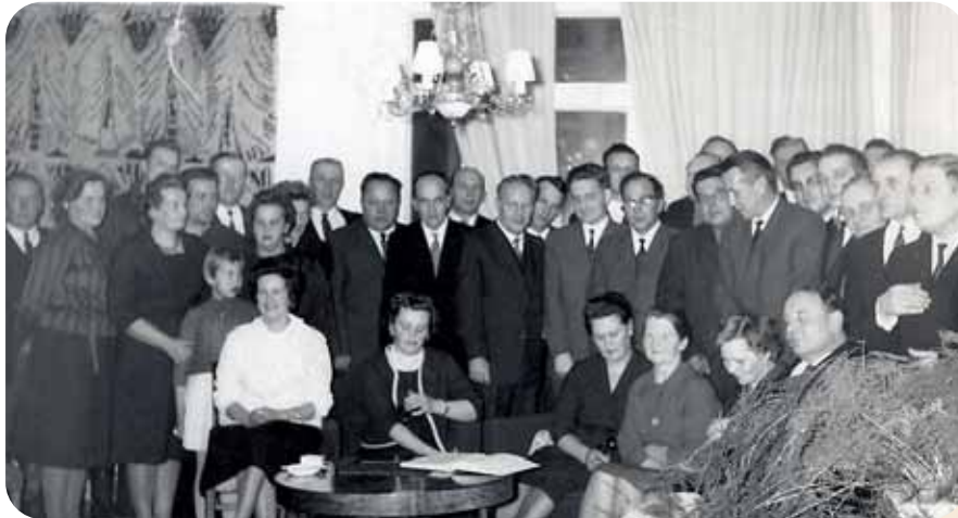
Ilmoitus yhdistysrekisteriin 18.12.1962.