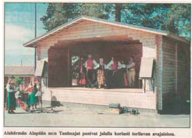
Alahärmän Alapään n:n Tanssajat puvut jalalla kortisti toriluvan avajaisissa.