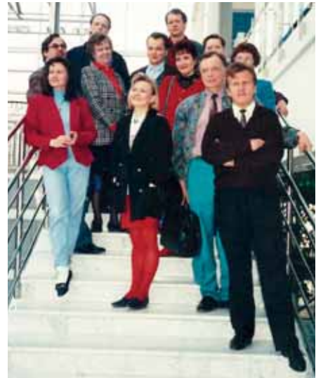
Kevätretkellä 1994 tutustuttiin mm. Tampere-taloon.

teltiin, mutta lopputuloksesta ei voitu olla varmoja. Virkitysmatka Keurusselkään, Keuruulle, matkalla tutustuttiin Jarometiin (Lillbackan konepaja), taidemuseoon ja vanhaan kirkkoon. Vuonna 1993 hyväksyttiin yhdistykselle uudet säännöt. Kahdet markkinat, toiset Härmä-päivien yhteydessä ja toiset perinteiset Isoo-Antin markkinat. Alko järjesti yhdistykselle viini-illan. Syksyllä tehtiin porukalla laivaretki Vaasa-Sundsvall-Vaasa.