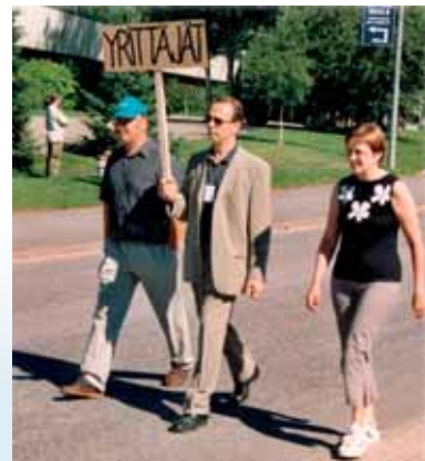
Härmäläisten häjyytyjen avajaisissa 2002 paikalliset yhdistykset siirtyivät kulkueena kirkolta koululle.