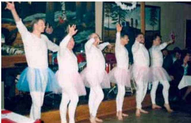
Pikkujouluiltoa tyylillä vuonna 1992. Pikkujoulut järjestettiin yhdessä yrittäjänaisyhdistyksen kanssa – ja ohjelmaa oli runsaasti!