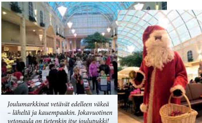
Joulumarkkinat vetävät edelleen väkeä – läheltä ja kauempaakin. Jokavuotinen vetonaula on tietenkin itse joulupukki!