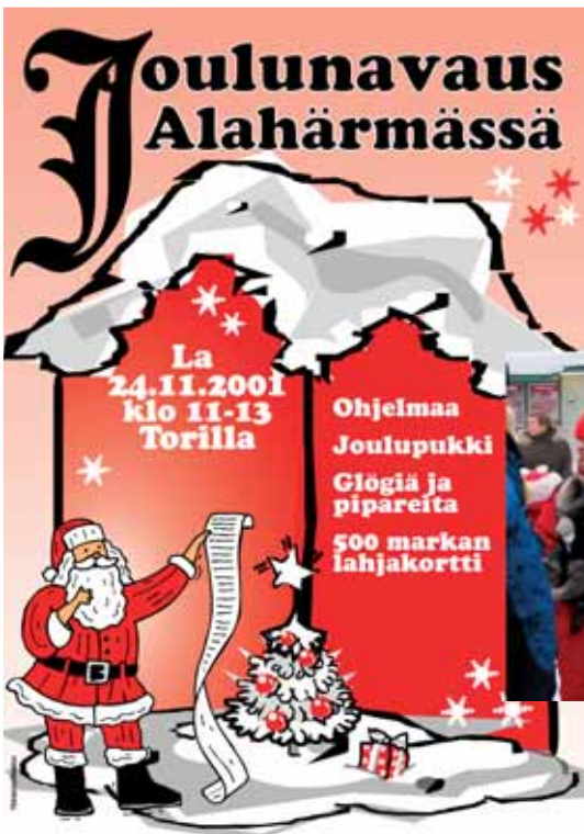
Joulunavauslehtiä julkaistiin vuosina 2001–2006.