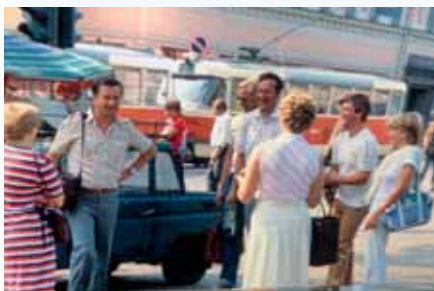
Matkailu avartaa – mm. Riika ja Moskova olivat kohteina.