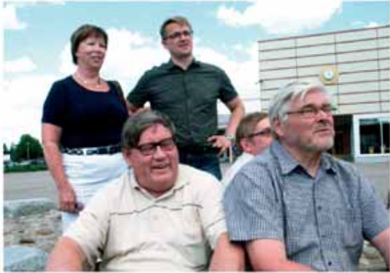
Kunniakonsuleita lähdössä yritysvierailuille.

Vuoden aikana aloitettiin led-tienvarsitauluhankkeen selvitys.