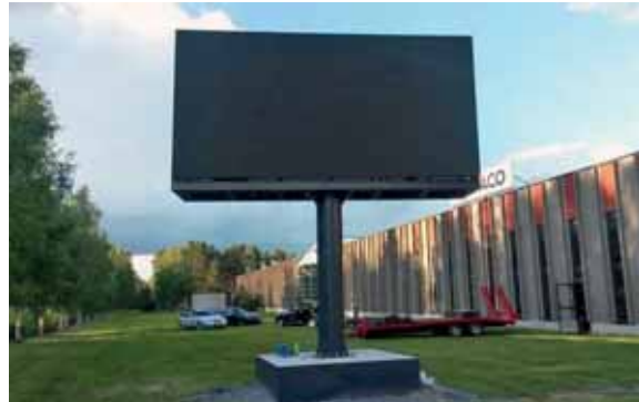
Led-mainostaulu pystytettiin vt 19:n varteen heinäkuussa.

Vuoden yrittäjäksi valittiin Rakennuspalvelu Pauli Katajamäki Oy .