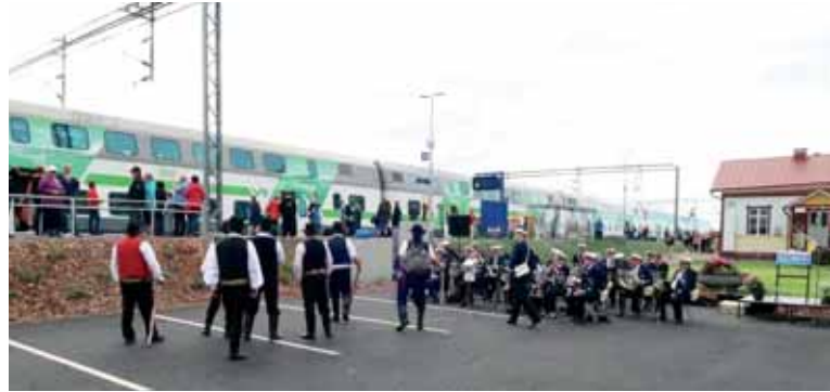
Härmän aseman uuden laiturin avajaisia vietettiin 19.6. soittokunnan ja häyjen voimalla.

Vuoden yrittäjäksi valittiin KJH-Comp Oy .