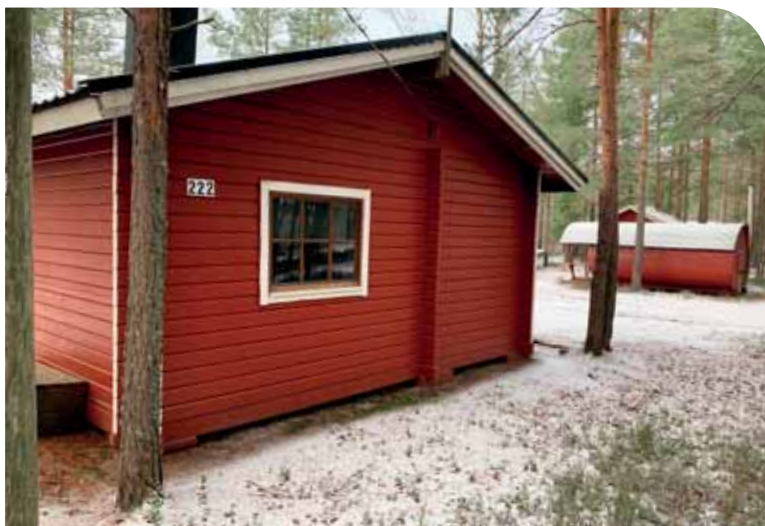
Yrittäjien mökillä kokoontuttiin mm. yhteisiin kesätapaamisiin ja vuokraustoiminta oli vilkasta 90-luvulla. Mökki ja sauna kuvattuna syksyllä 2022.

Osallistuttiin Alahärmän Yrittäjänäisten aloitteesta hankittaviin jouluvaihtoihin 10.000 mk:lla. Vuoden yrittäjäksi valittiin Kuljetus Nukala Oy .