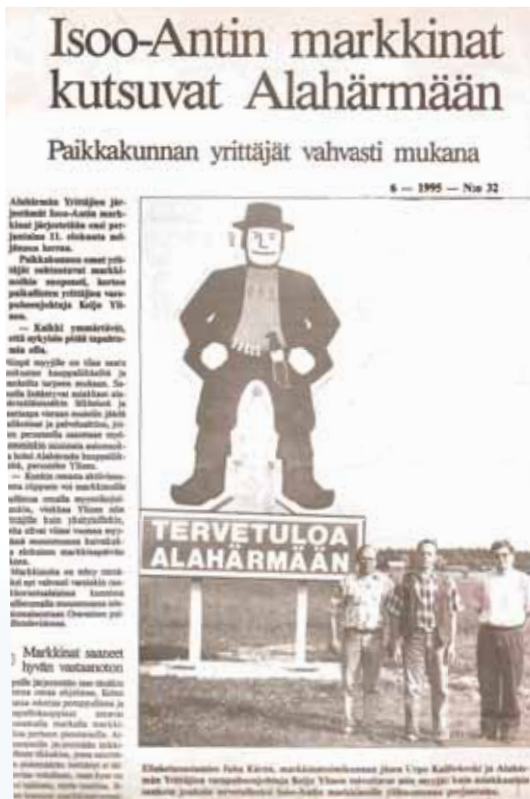
Vuonna 1995 Isoo-Antin markkinat jo neljättä kertaa. Härmät-lehti elokuussa 1995.