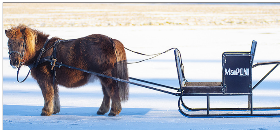
Ponireki on suosittu.

”Renkaiden vaihdosta suuri osa kohdistui raskaan