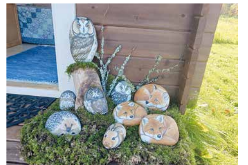
Katin kiviin maalaamia eläimiä.

tohimu ja omistautuminen luovat perustan yritykselle. Yritys yhdistää taiteen, luonnon ja yrittäjyyden