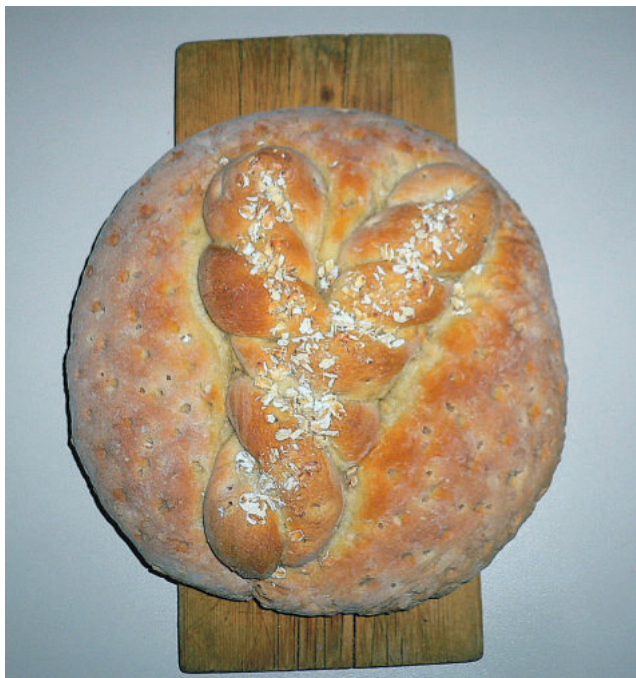
Oulaisten Yrittäjien leipä.

Tulevaisuuteen hän toivoo, että yrittäjät ymmärtäisivät, että yhdistyksen kautta vaikuttaminen on helpompaa ja vaikuttavampaa.