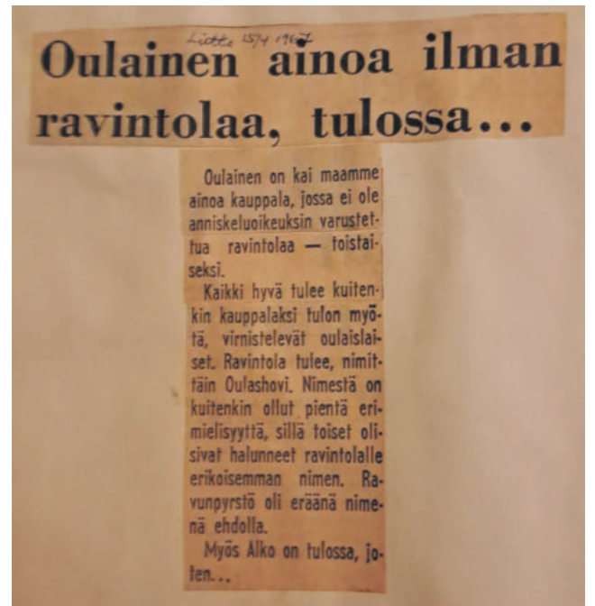
Liitto-lehden julkaisu 15.4.1967.

Paikallinen yhteistyö on aktiivista: ”Oulaisissa on laaja yrittäjäkunta ja tehdään usein yhteistyötä isompia tapahtumia järjestettäessä.” Oulaisten Yrittäjien yhdistys on aktiivinen ja tekee hyvää työtä.