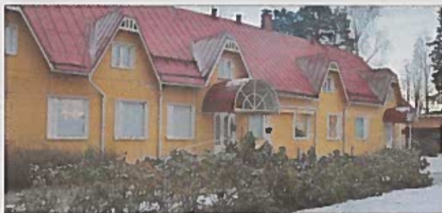
Elorannan palvelukoti on toiminut lähes 25 vuotta.

Toimintatapoja on kehitettävä koko ajan.