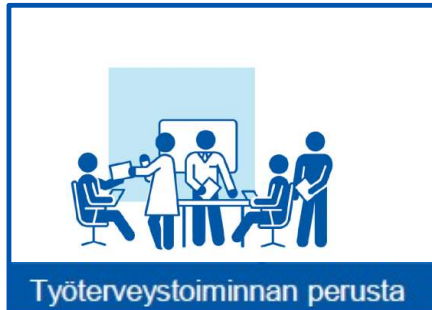
Työterveystoiminnan perusta TYÖTERVEYDEN PERUSTA (LAKISÄÄTEINEN) Ennaltaehkäisevä työterveyshuolto