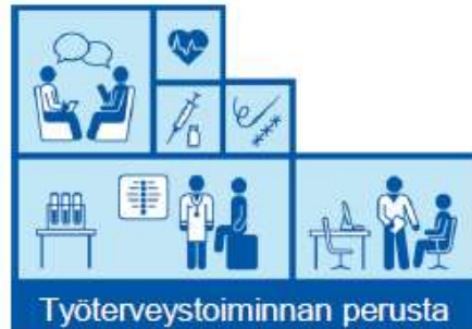
Työterveystoiminnan perusta SOPIVA Hyvä ennaltaehkäisevä ja suppea sairaanhoito