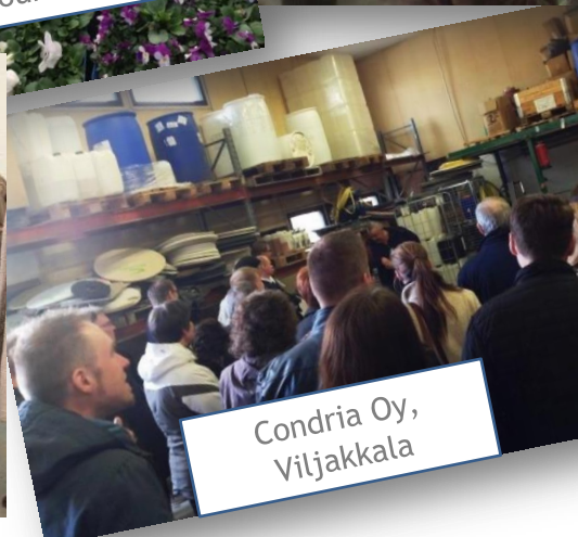
Condria Oy, Viljakkala