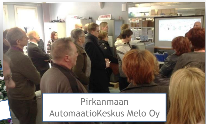
Pirkanmaan AutomaatioKeskus Melo Oy