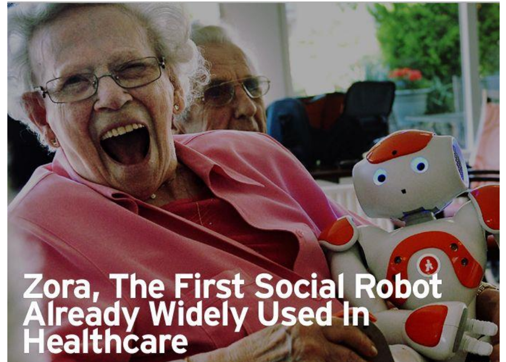
Zora, The First Social Robot Already Widely Used In Healthcare

Palvelu tulevaisuuteen: eMaaseutu -hanke