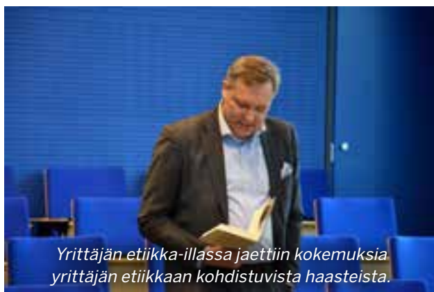
Yrittäjän etiikka-illassa jaettiin kokemuksia yrittäjän etiikkaan kohdistuvista haasteista.