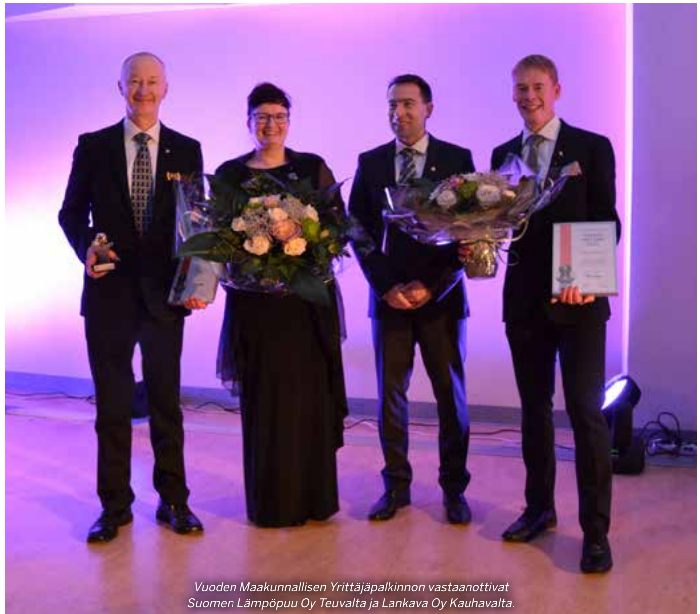
Vuoden Maakunnallisen Yrittäjäpalkinnon vastaanottivat Suomen Lämpöpuu Oy Teuvalta ja Lankava Oy Kauhavalta.