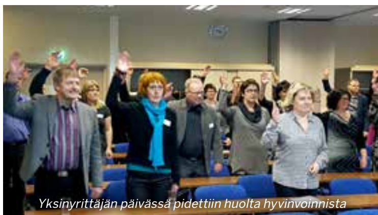
Yksinyrittäjän päivässä pidettiin huolta hyvinvoinnista