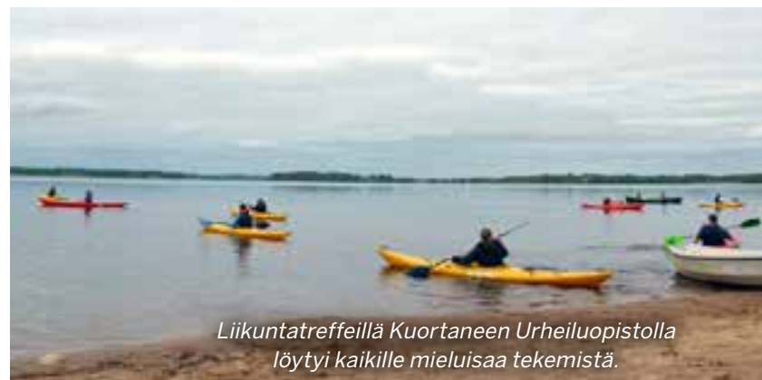
Liikuntatrefeillä Kuortaneen Urheiluopistolla löytyi kaikille mieluisaa tekemistä.