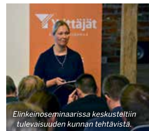
Elinkeinoseminaarissa keskusteltiin tulevaisuuden kunnan tehtävistä.