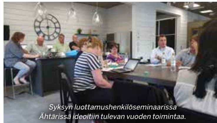
Syksyn luottamushenkilöseminaarissa Ähtärissä ideoitiin tulevan vuoden toimintaa.