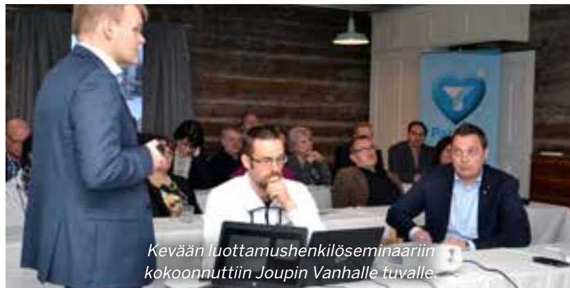
Kevään luottamushenkilöseminaariin kokoonnuttiin Joupin Vanhalla tuvalla

Etelä-Pohjanmaan Yrityspörssi on osa valtakunnallista Suomen Yrittäjien ylläpitämää Yrityspörssijärjestelmää. Suomen Yrittäjät julkaisivat myös vuonna 2016 valtakunnallisen Yrityspörssi-indeksin, jossa Etelä-Pohjanmaa on kärkisijalla. Indeksikuva maakunnittain yrityskauppa-aktiivisuutta Yrityspörssi-sivustolla olevien osto- ja myynti-ilmoitusten perusteella. Alueellisessa Yrityspörssissä julkaistiin vuoden aikana yhteensä 40 uutta ilmoitusta. Etelä-Pohjanmaan Yrityspörssin ilmoitusten katselukertojen kokonaismäärä oli 128 063 kertaa. Ilmoituksia julkaistiin myös TE-toimistojen sivustoilla. Avoimuus lisääntyi myytävien