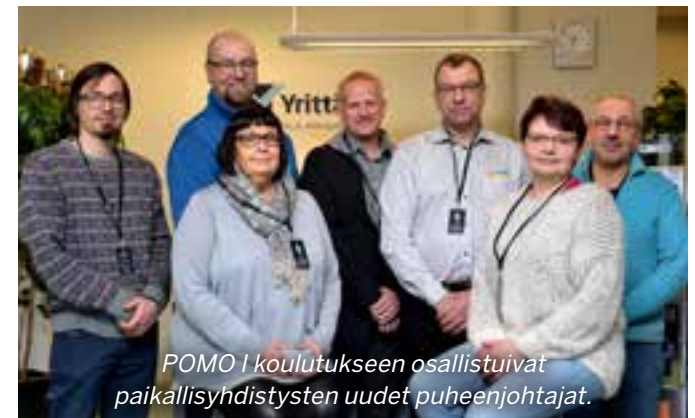
POMO I koulutukseen osallistuneet paikallisyhdistysten uudet puheenjohtajat.