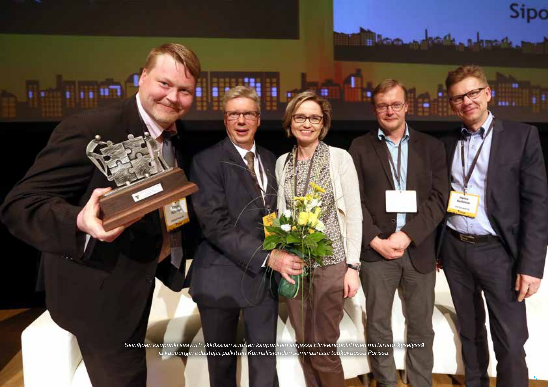
Seinäjoen kaupunki saavutti ykkössijan suurten kaupunkien sarjassa Elinkeinopoliittinen mittaristo-kyselyssä ja kaupungin edustajat palkittiin Kunnallisjohdon seminaarissa toukokuussa Porissa.