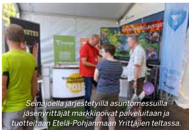
Seinäjoella järjestetyillä asuntomessuilla jäsenyrittäjät markkinoivat palveluitaan ja tuotteitaan Etelä-Pohjanmaan Yrittäjien teltassa.

Sidosryhmien kanssa yhteistyössä toteutettu Yrittäjyydellä menestykseen-tee-mavuoden tapahtumia oli paljon. Kuukausittaiset päätapahtumat saivat näkyvyyttä mediassa, osa myös valtakunnallisesti, muun muassa Taitaja-kisat ja Asuntomessut.