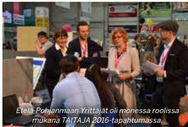
Etelä-Pohjanmaan Yrittäjät oli monessa roolissa mukana TAITAJA 2016-tapahtumassa.