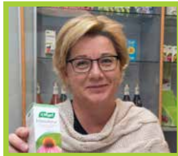
A.VOGEL OY MENESTYY KLONDYKESSÄ