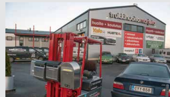
Trukkihuolto Marjeta muutti Huhtimoon vuonna 2013. Postilaatikat ovat tietty trukissa...