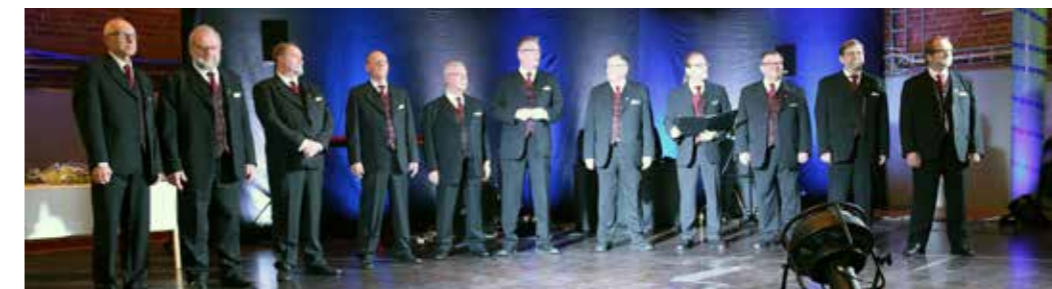
Keravan Mieslaulajat esitti mm. komean Finlandia-hymnin, joka sopi Suomi 100 -teemaan.