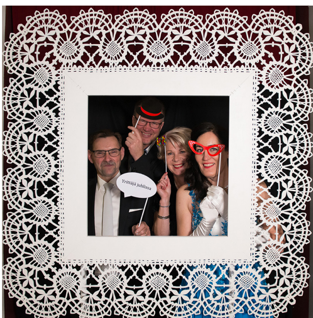
Vuoden 2017 syysjuhlissa hulluteltiin pitsikehyksellä ja rekvisiitilla.

Syysjuhilla on yrittäjäjärjestössä pitkät perinteet. Tapahtuma on yhdistyksen isoin vuosittainen tapahtuma, joka kokoaa 100-150 henkeä yhteen viihtymään. Tilaisuuden yhteistyökumppaneina ovat pitkään olleet Rauman Yrittäjät -säätiö, Lännen Omavoima sekä Länsi-Suomen Osuuspankki. Tänä vuonna juhlien toteuttamisessa on mukana myös Rauman Offsetpaino, joka suunnitte-