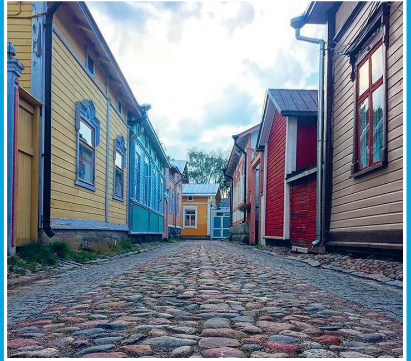
Pitkä ja mukulakivinen tie #rakastunutraumaan #isopoikkikatu #mukulakivi #vanharauma #visitrauma

Rauman Yrittäjät ja Rakastunut Raumaan -toiminnan löydät facebookista. #raumanyrittajat #rakastunutraumaan