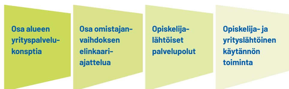
KUVIO 1. Toimivan Jatkajakoulun ominaisuuksia

Selvityksen tarkoituksena oli myös nostaa keskusteluun oppilaitosten ja korkeakoulujen yhteydessä toimivien Jatkajakoulujen toiminnan edellytyksiä. Selvityksen perusteella muotoiltiin toimivan Jatkajakoulun ominaisuuksia.