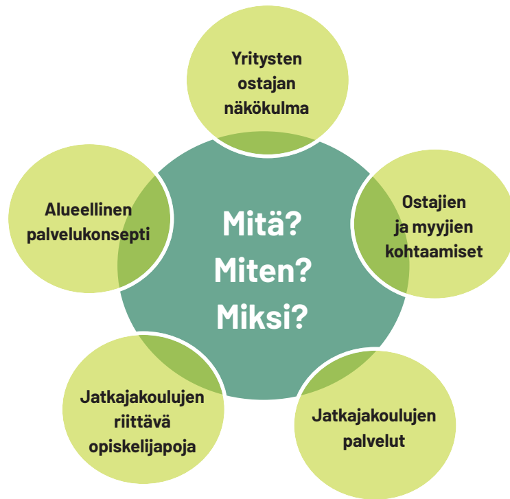
KUVIO 3. Opiskelijasta omistajaksi – ratkaistavia kysymyksiä

Keskusteluun nousee kysymyksiä, joita jatkossa voidaan ratkoa yhteistyössä eri foorumeilla sekä voidaan nostaa esille myös uusia ratkaistavia asioita eri toimijoiden näkökulmasta.