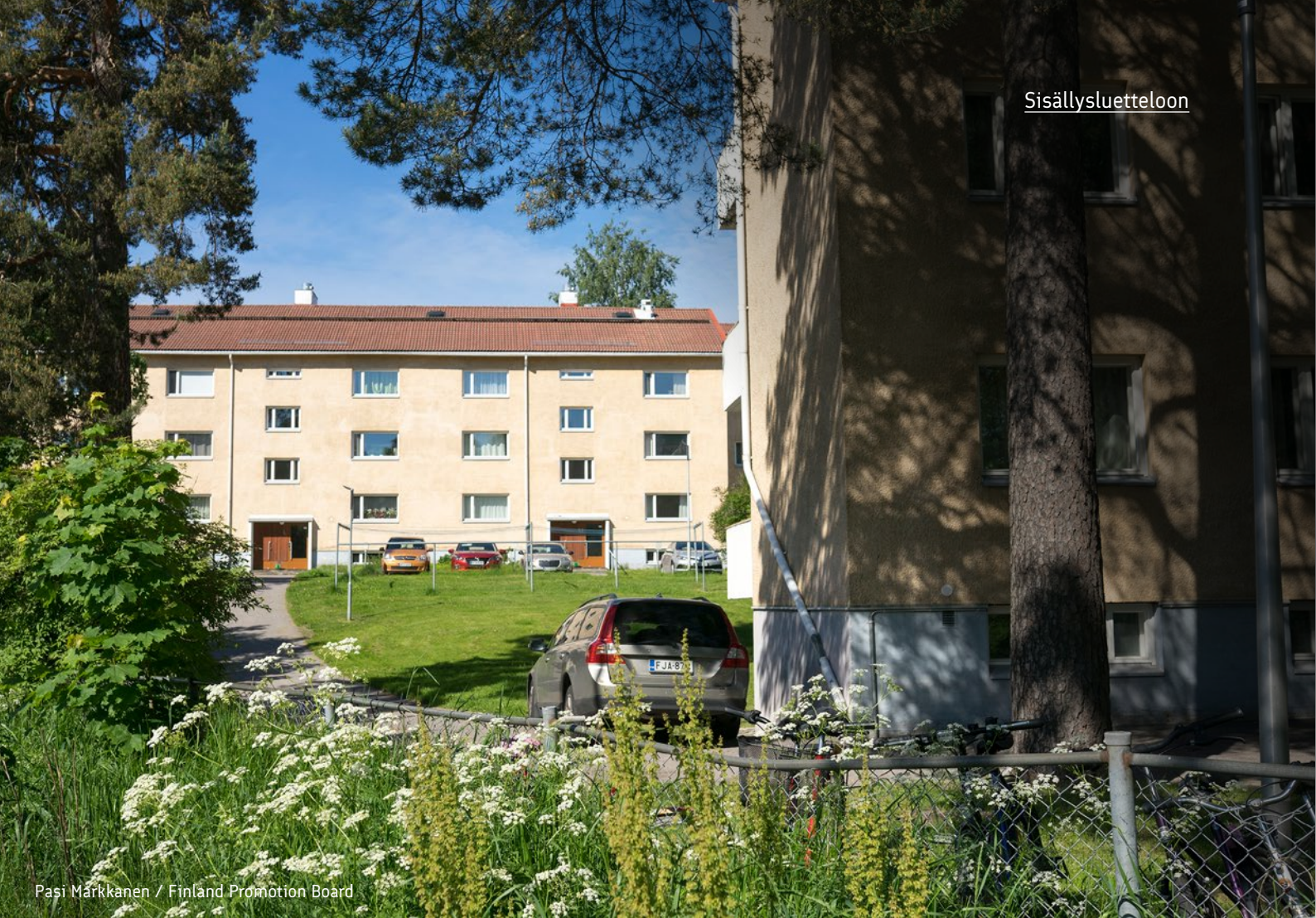
Pasi Märkkänen / Finland Promotion Board

katsomaan vasta kun asukasvalinta on tehty. Tämä saattaa tulla yllätyksenä ensimmäistä kertaa Suomesa asuntoa etsivälle.