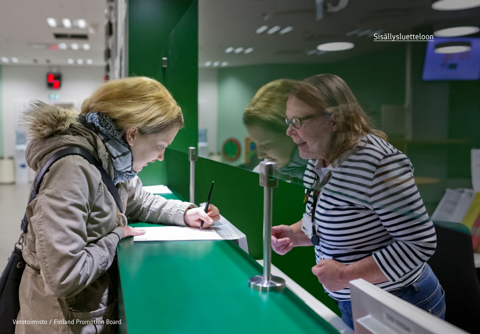
Verotoimisto / Finland Promotion Board

toimijat, kuten pankit ja vakuutusyhtiöt. Lisäksi yksityiset terveyspalveluntarjoajat varmistavat asiakkaan henkilöllisyyden henkilötunnuksen avulla.