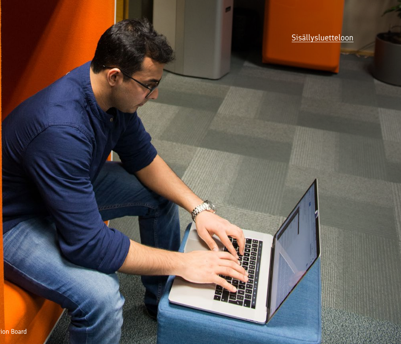
Jarno Mela / Finland Promotion Board