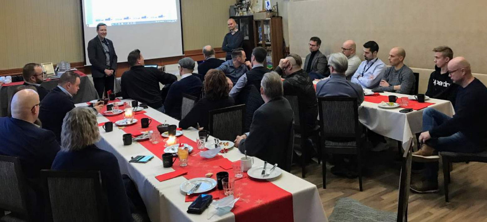
Tech Teamin ohjausryhmä kokouksessaan marraskuussa 2021