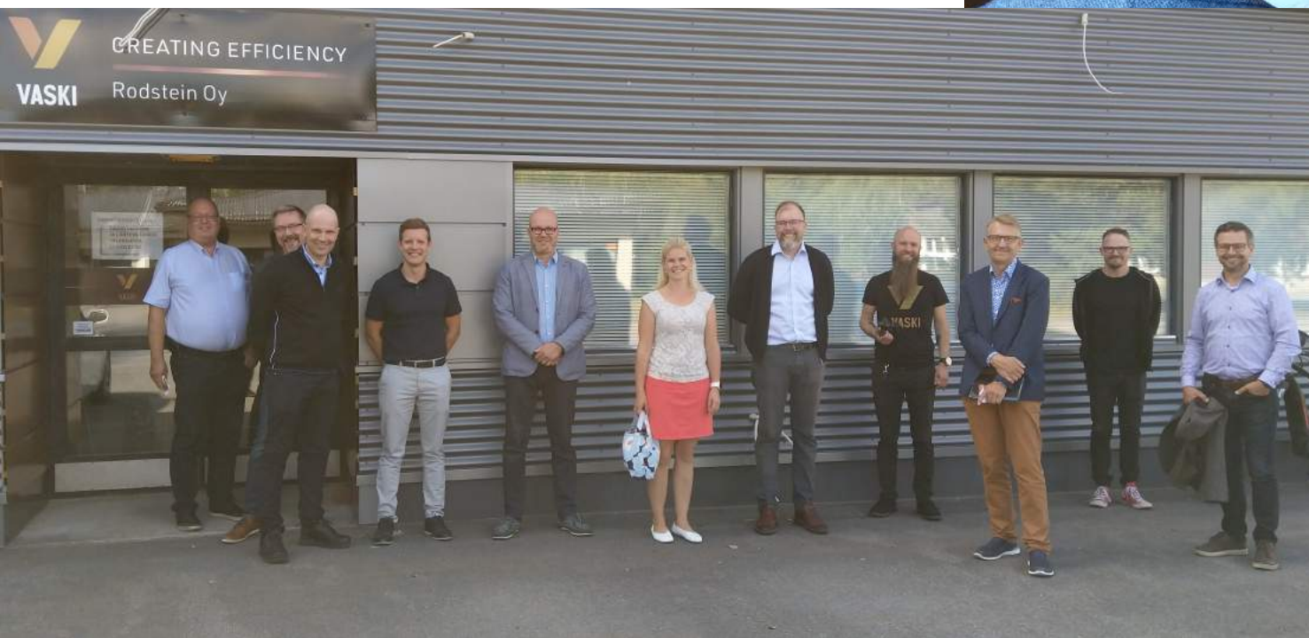
Satakunnan vieraat Seinäjoella