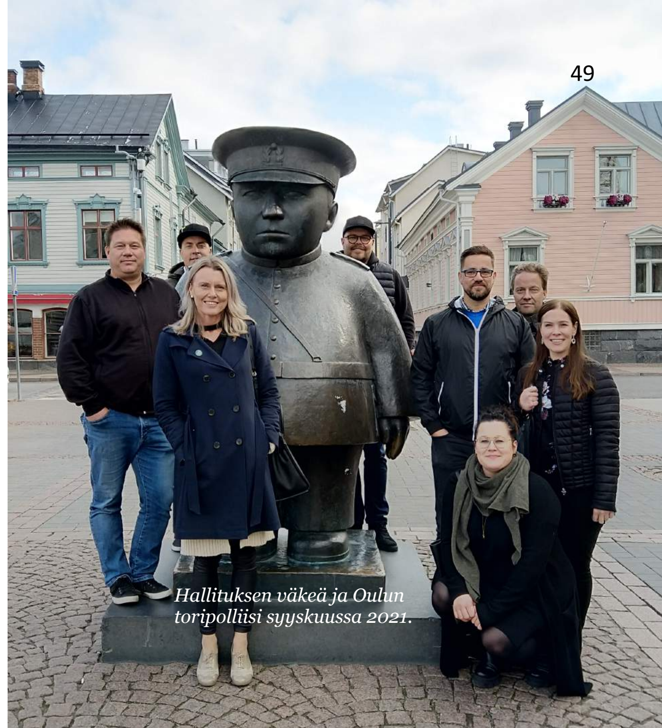
Hallituksen väkeä ja Oulun toripolliisi syyskuussa 2021.