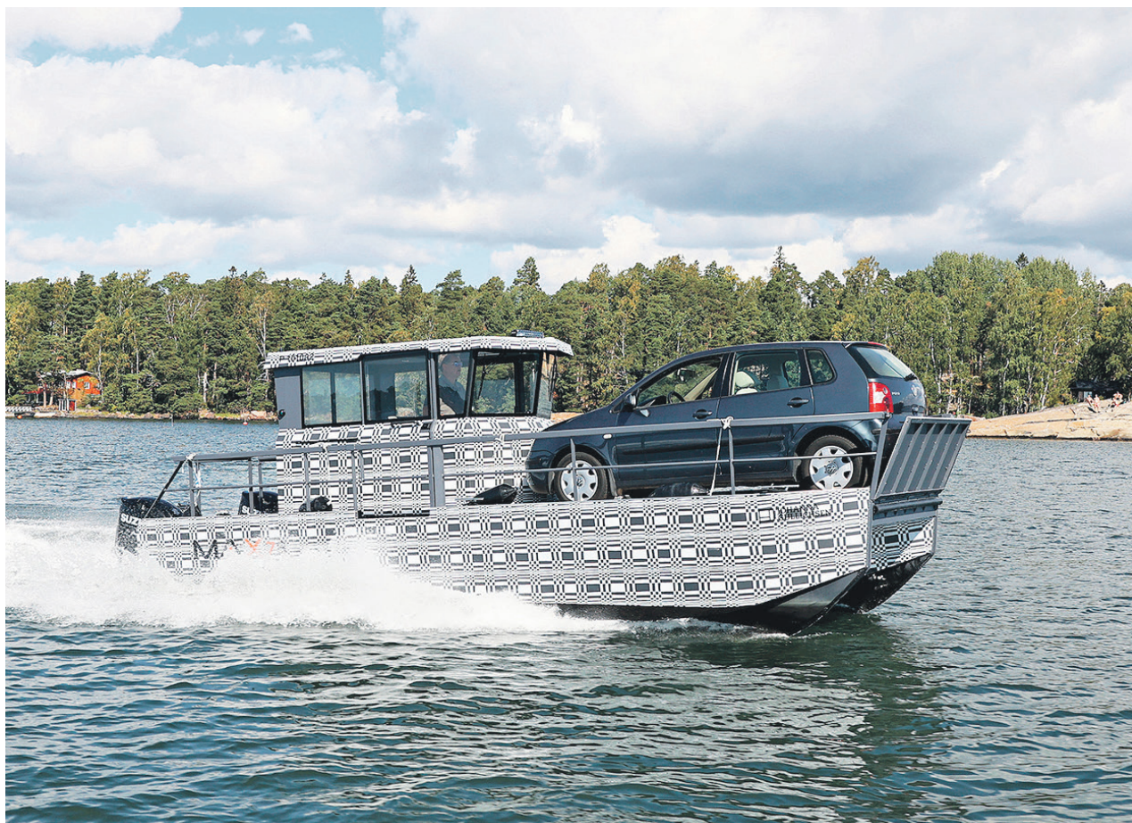
MAX-veneiden kantokyky on ylivoimainen tavalliseen veneeseen verrattuna. Tuotekehityksen kautta myös nopeus esimerkiksi henkilöauto kannella on jopa 35 solmua.