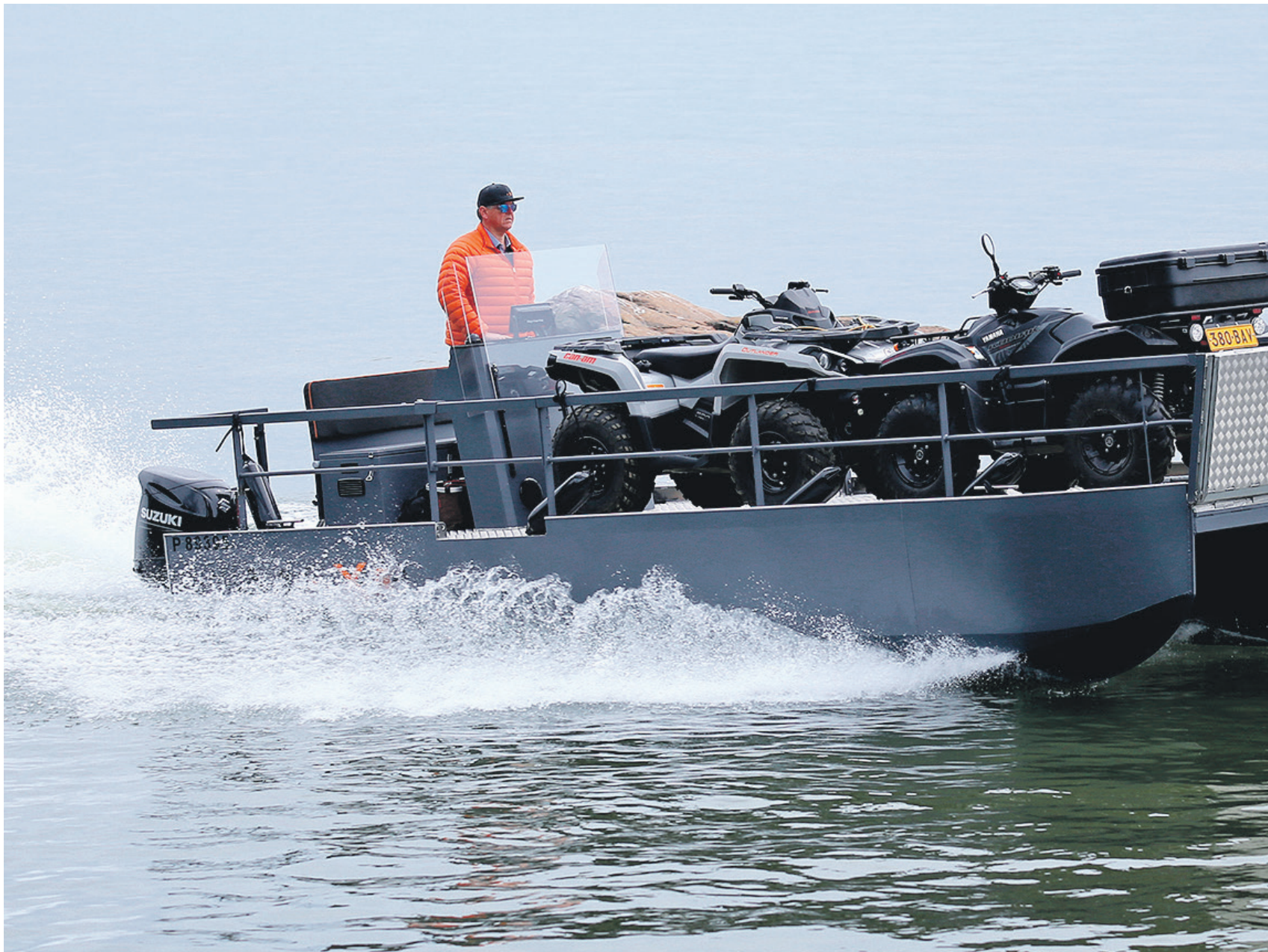
MAX-veneet ovat vakaita ja käyttäytyvät aallokossa erinomaisesti.

Tavoitteena oli saada alun perin tavarankuljetusveneeksi kehitetty alumiinikatamaraani nopeaksi veneeksi, jolla kuitenkin pystytään kuljettamaan lastia. Entisestä 15-