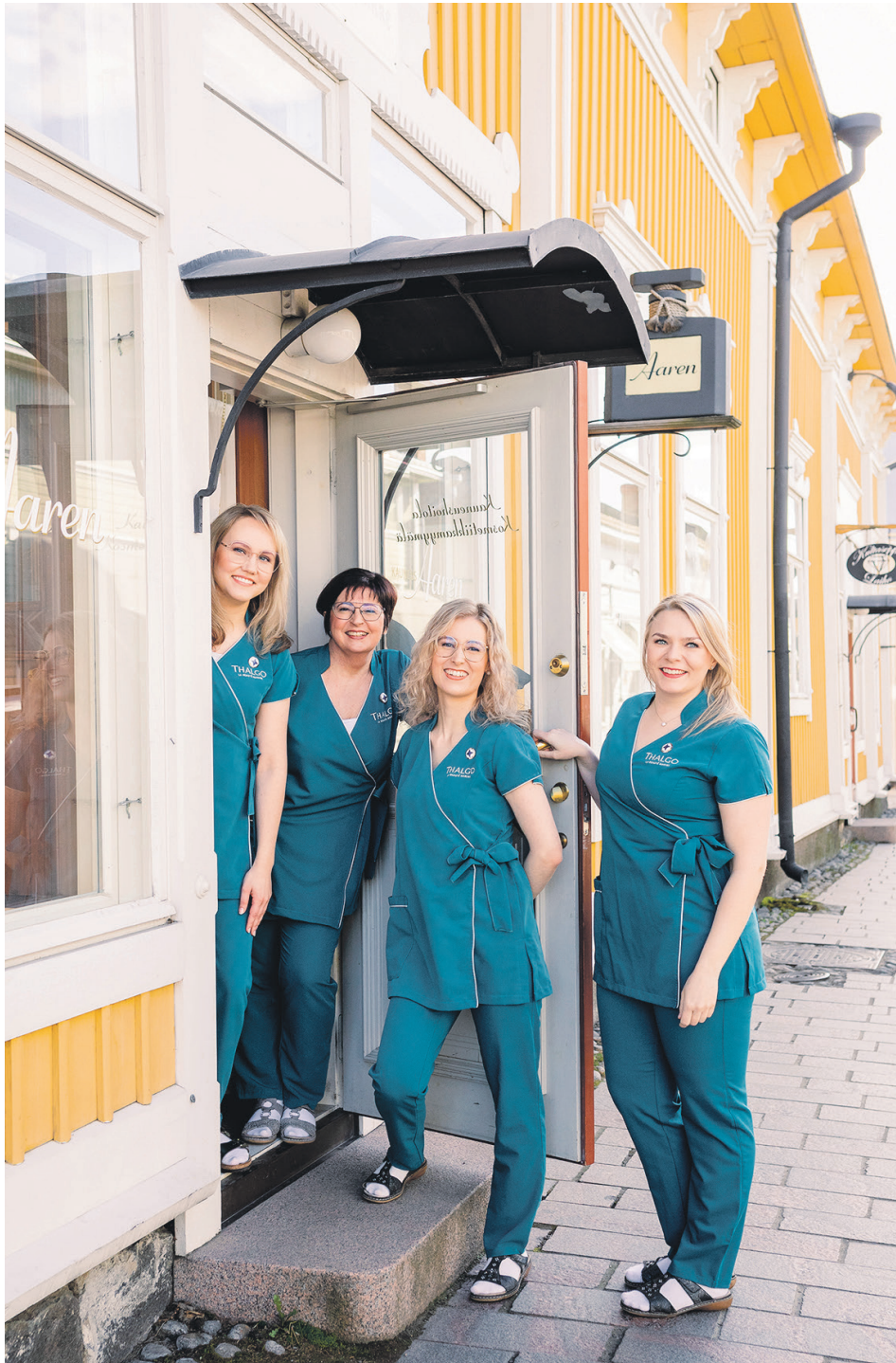
Kuninkaankadulta löydät ihonhoidon ammattilaiset, joille paras kiitos on asiakkaan hyvä olo ja mieli.