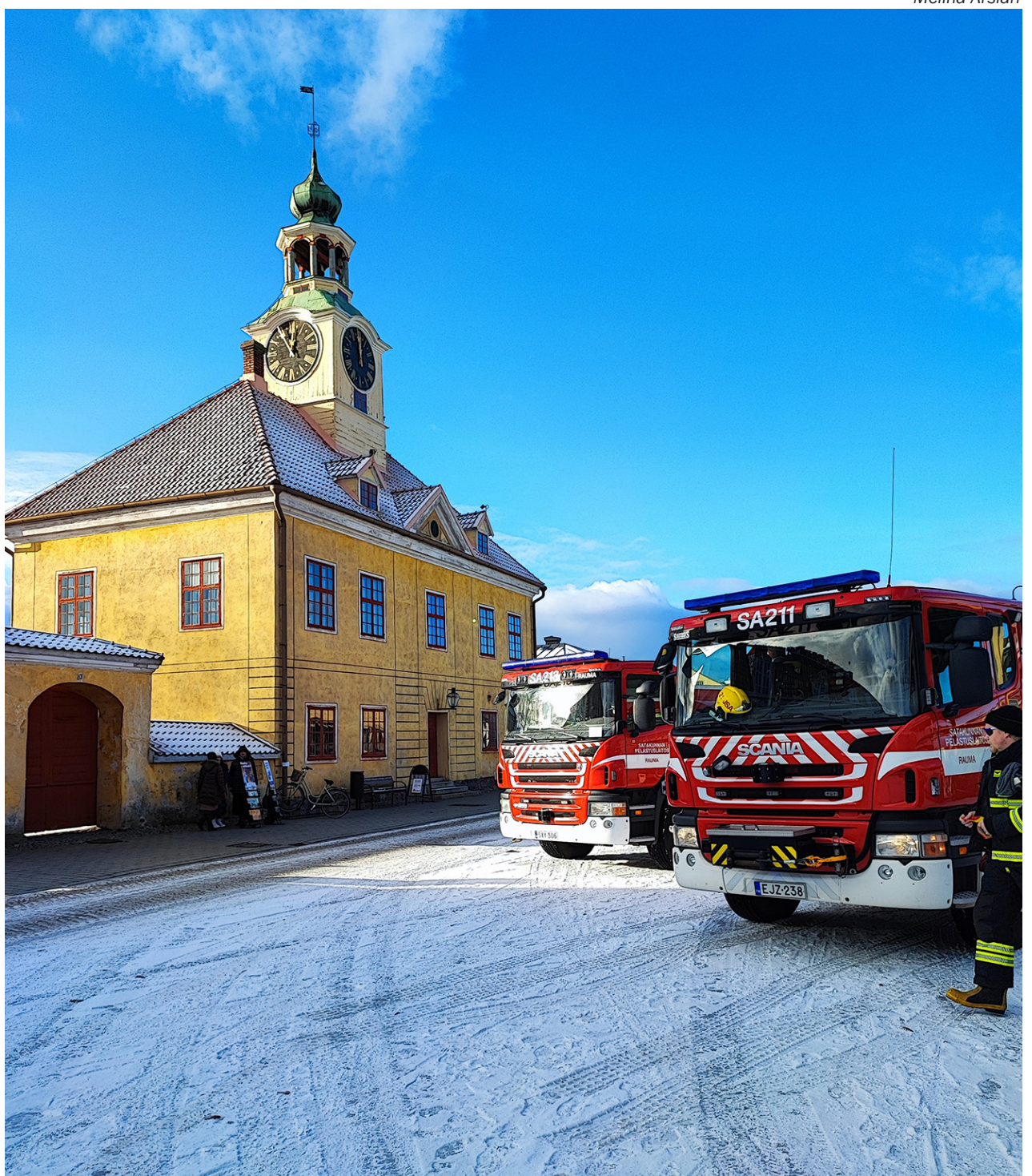
112-päivänä raumalaisia hemmoteltiin auringonpaisteella.