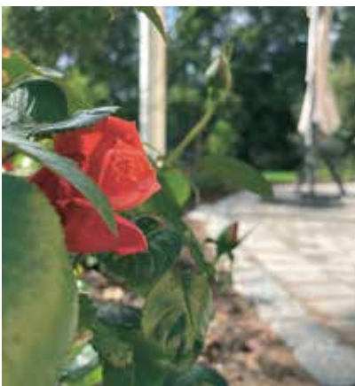
Blommor drar ögat till sig och skapar känsla av omsorg.