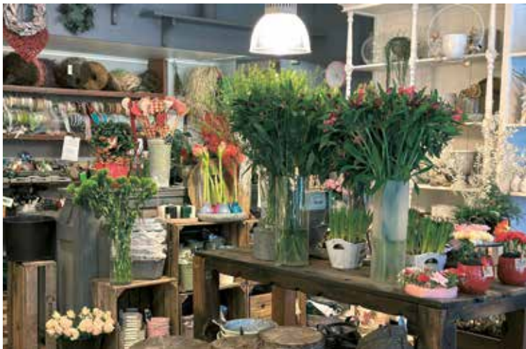
Det är färgterapi att besöka Happy Flower. Här tornar höga inkaliljor upp. De odlas i Holland och Towe gillar att de inte är så energikrävande att driva upp.