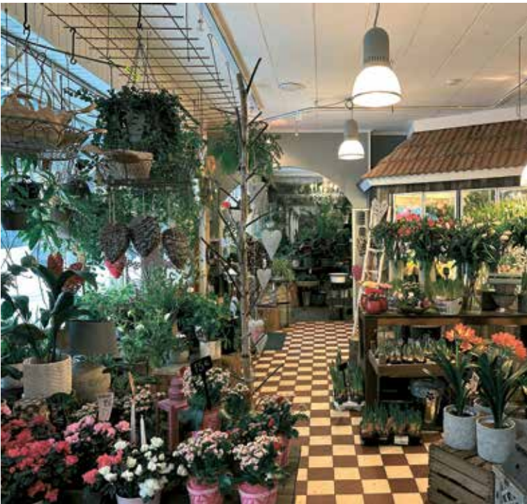
Blomsterhandeln i Karis har gamla anor och är betydligt större än den genomsnittliga blombutiken.

tiden var då ännu inte mogen att gå från anställd till företagare. Det skulle ta ytterligare några år innan drömmen om den egna butiken förverkligades.