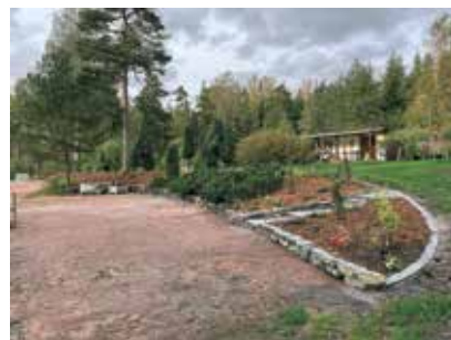
En välplanerad trädgård ger förutsättningar att nyttja trädgården optimalt, oberoende om man vill ha den lättskött eller mångsidig.