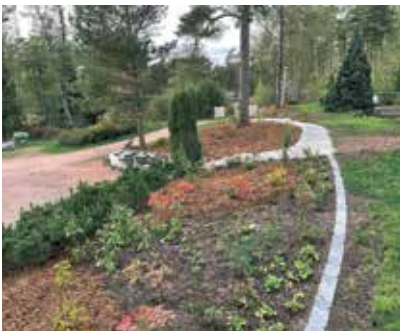
Om sommaren bygger och sköter Qvisten trädgårdar, vintern är till för planering.