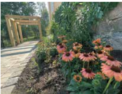
Qvisten både planerar och renoverar trädgårdar.

Man kan ha fleråriga växter, men säsongsplanteringar är lättare att hålla snygga året om. Mitt råd till företag är att satsa på infarten och ingången. De berättar hur noggrant företaget är med detaljer.