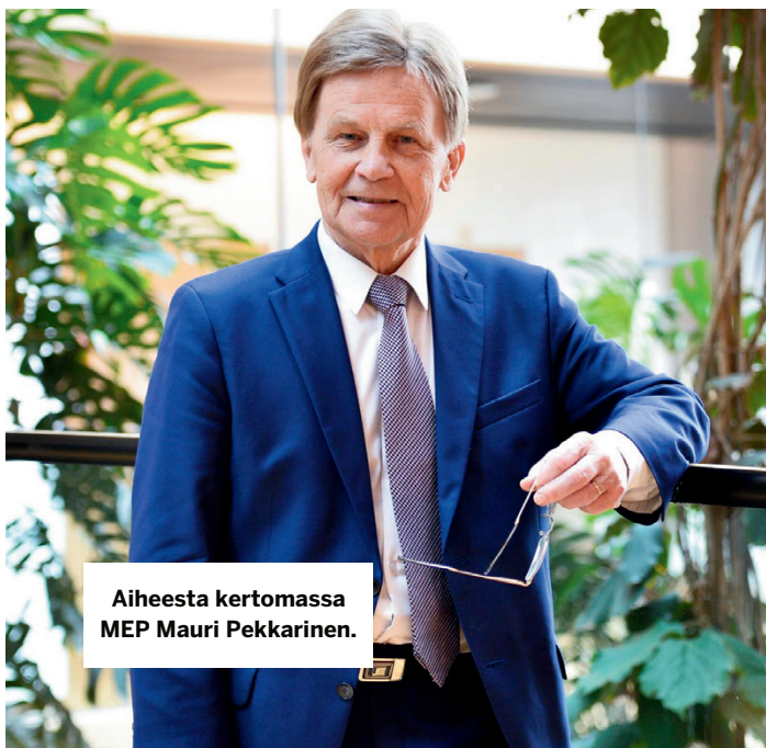
Aiheesta kertomassa MEP Mauri Pekkarinen.

Yritysasiantuntijalta saa neuvoa hankkeen suunnitteluun ja avustushakemuksen tekoon ja häneltä saa