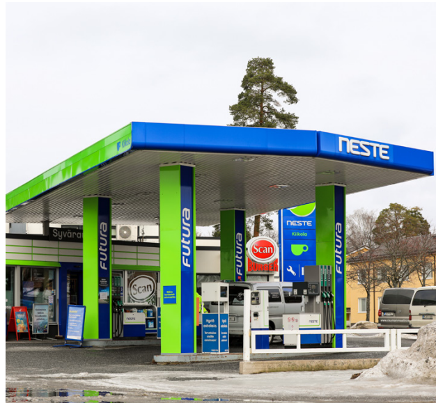
Neste Kiikola on perinteinen huolto-asema Raumalla.

Kyllä me suosittelemme yrityskaupoissa välittäjän käyttöä. Se selkeyttää monia asioita.